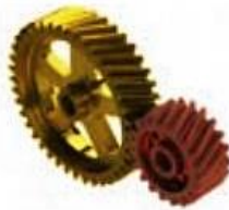
ب- ساز و کار حرکتی چرخ دنده مارپیچ