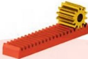
ث- ساز و کار حرکتی چرخ دنده شانه‌ای ساده