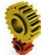
الف- ساز و کار حرکتی چرخ دنده ساده