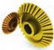
ب- ساز و کار حرکتی چرخ دنده مخروطی