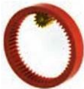
ج- ساز و کار حرکتی چرخ دنده داخلی